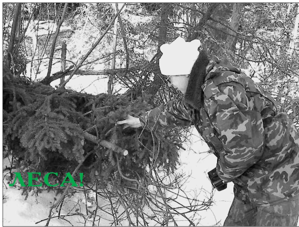
Участник рейда показывает незаконно спиленную ель.

Экологи серьёзно обеспокоены также и тем, что всё больше сжимается кольцо вокруг самой ценной территории – лесопарковой зоны города.