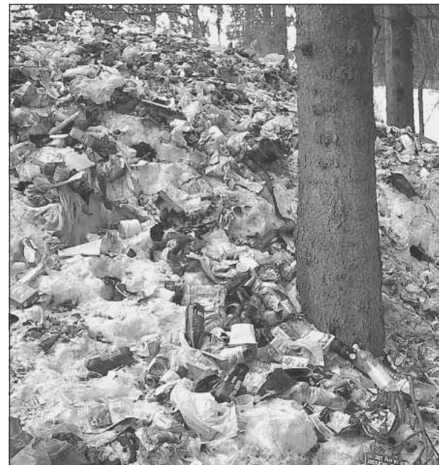
Горы мусора сваливаются в зелёной городской зоне (на фото помещилась лишь пятая часть одной из многих куч мусора).