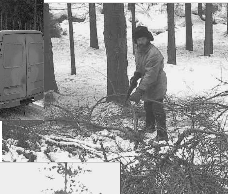
Местный житель за сбором лесных остатков от "деятельности" браконьеров.