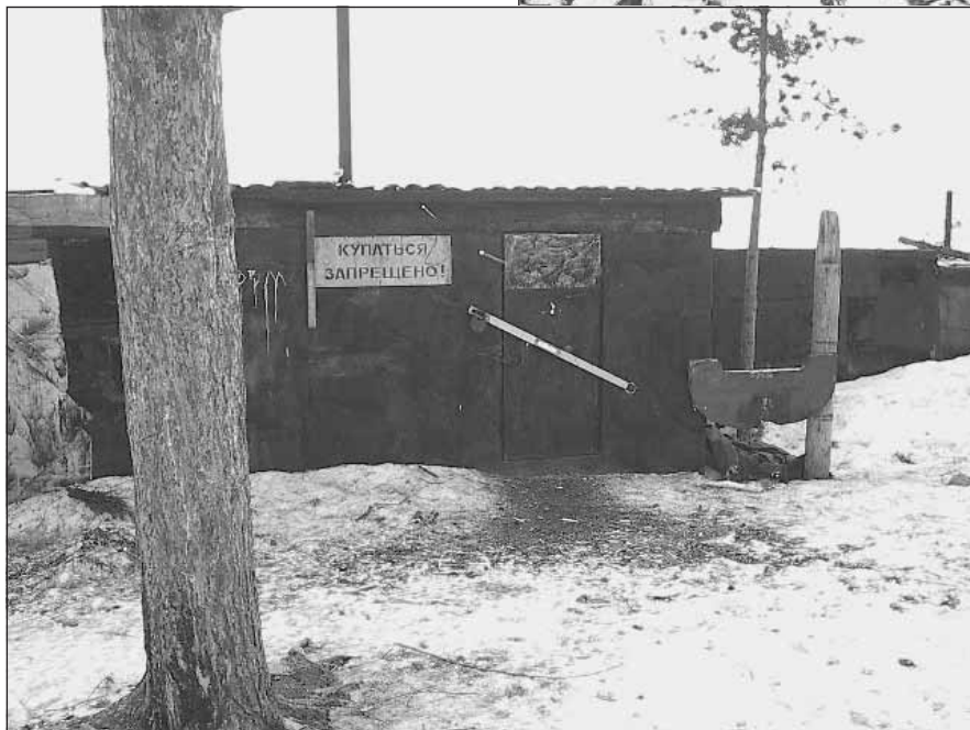
Незаконные постройки в зелёной зоне на берегу Онежского озера.