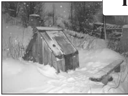
к попаданию вредных примесей из шунгитового наполнителя в питьевую воду. – Ред.)

Казалось бы, проблемы с питьевой водой в городе не должно быть, потому что в водопроводную сеть, она, как правило, поступает без перебоев. Однако её качество зачастую не соответствует ГОСТу. Тому есть несколько причин, и главная из них в том, что на очистных сооружениях водопровода устарела технология очистки. А между тем буквально в зелёной зоне города имеются огромные запасы минерала, так называемого шунгита. Специалисты прекрасно осведомлены о его прекрасных природных качествах. Но первыми, кто не только оценил, но и стал этот камень использовать для очистки воды, стали предприимчивые деятели С.-Петербурга и Москвы. Они стали выпускать различные бытовые фильтры для очистки водопроводной воды, используя шунгит. (Часть учёных полагает, что применение таких фильтров приводит