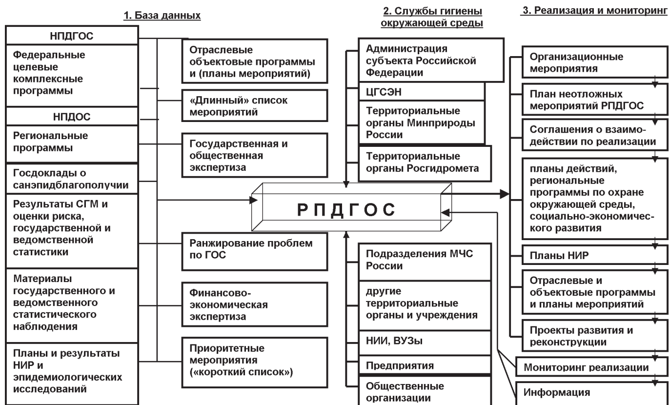
Схема разработки и реализации РПДГОС

полностью не отражают сути НПДГОС на региональном уровне. Поэтому Правительству РК, видимо, следует обратить внимание на необходимость разработки и принятия такого Плана действий применительно к существующей ситуации с участием как региональных, так и федеральных структур, а также неправительственных организаций.